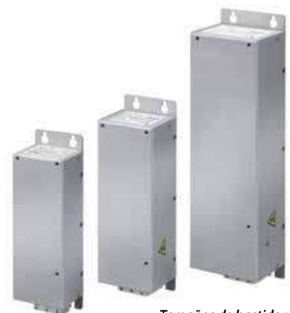
Tamaños de bastidor Tres tamaño del bastidor de los filtros de línea distintos se corresponden con los alojamientos M1, M2 y M3 del convertidor de frecuencia VLT® Micro